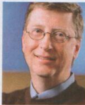
Bill Gates ist der größte Wohltäter unter den Reichen.

Vom Tellerwäscher zum Millionär, das ist der heimliche Traum so manchen Arbeiters. Dabei ist die andere Variante, vom Garagentüftler zum Milliardär, sehr viel lukrativer. Das hatte sich auch Bill Gates gedacht und mal eben Microsoft erfunden – mit den allseits bekannten Auswirkungen. Und nun, etwa 30 Jahre später, gehört er zu den reichsten Menschen der Welt und führt die Liste der 50 großzügigsten Reichen an. Kein Wunder, hat ihm sein Vater William doch ein hehres Leitmotiv mitgegeben: „Der Mann, der reich stirbt, stirbt in Schande.“ So hat Gates mit seiner Frau Melinda bereits 23 Milliarden Dollar (wirklich!) für wohltätige Zwecke gespendet, die in eine eigens gegründete Stiftung geflossen sind. Und es bleibt immer noch genug übrig, um es zu Lebzeiten nicht ausgeben zu können. In Schande muss er sicherlich trotzdem nicht sterben.