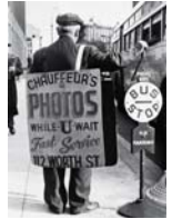
Links und Rechts: Sandwichmänner in New York, um 1930. Rechts: Sandwichmann in Amsterdam, um 1930.

Den Namen verdanken sie ihrer äußeren Erscheinung: Jeweils eine mit Plakaten oder Anzeigen beklebte Papptafel vor dem Bauch und auf dem Rücken strahlten sie den damals in den USA populären belegten »Doppelseiten-Brötchen«. Vor den Augen der Passanten kündigten sie Veranstaltungen an, warben für Shows und Jams oder trugen politische Parolen in die Öffentlichkeit. Gerade in Zeiten hoher Arbeitslosigkeit versinglen sich viele als Spaziergänger im Dienst der Reklame – für einen kärglichen Lohn. Dabei waren ihre Einsätze nicht ganz ungefährlich: durch polizeiliche Vorschriften von Bürgersteig verbannt, durften sie nur am Fahrbahnrand in Reihe marschieren. Die schon 1908 in die Großstädte einziehenden sommerbeschirmten Paroli-Werter in Weiß konnten indes auf keinen Fall übersehen werden.