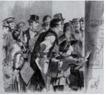
Litfaßsäule in Berlin während des Krieges, Deutschland, 1911 Links: Die erste Litfaßsäule wurde 1854 in Berlin aufgestellt. Links: Eigenwerbung für die Litfaßsäule als Streifenmodell, 1934.

Das geschah allerdings unter der Auflage, auch die neuesten Nachrichten anzuschlagen. Im Jahre 1855 wurden die ersten 100 Litfaßsäulen in Berlin aufgestellt und dem Erfolge zu Ehren nach ihm benannt. Im Jahre 1860 wurden weitere 50 Säulen aufgestellt. Sowohl die Behörden als auch die Werbekunden erkannten schnell die Vorteile des neuen Werbemediums. Von staatlicher Seite war eine vorherige Zensur von den Anschlägen möglich. Die Werbekunden konnten sich darauf verlassen, dass ihre Plakate auch wirklich für die gesamte gemietete Zeit ohne Überhebungen zu sehen sein würden. Während der Kriegsjahre 1870/71 wurden hier die ersten Kriegespedeschen veröffentlicht. Die Litfaßsäulen hatten auch die zusätzliche Funktion als Telefonvermittlung oder Transformatorstation.